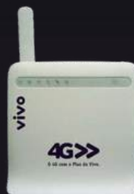
Modem de mesa